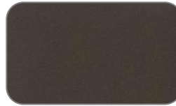
K7N Galaxy Brown