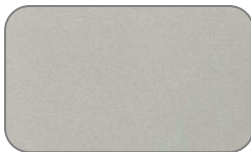
K3Y Celestian Silver