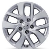
L: 16" aluminiowe obrzęcze kół z oponami w rozmiarze 205/55 R16