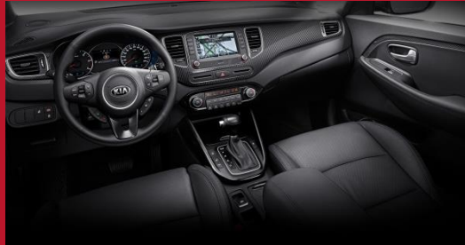
1 - tonowa czarna (WK)