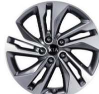
XL: 18" aluminiowe obrzęcze kół z oponami w rozmiarze 225/45 R18