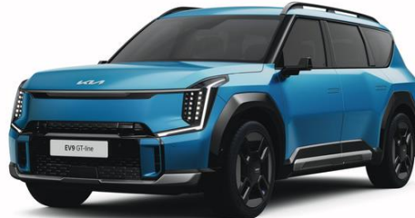
Ocean Blue (OBM) matowy, nieдоступny dla Earth