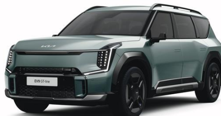
Iceberg Green (IEG) metalizowany