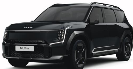
Aurora Black (ABP) metalizowany