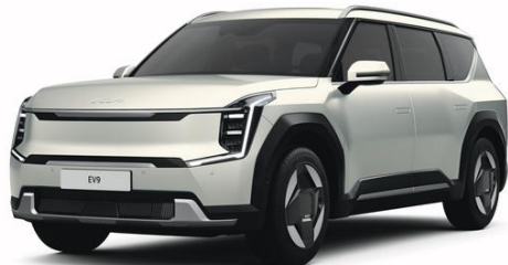
Ivory Silver (ISM) matowy, nieдоступny dla GT-Line