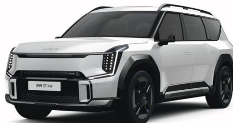
Snow White (SWP) metalizowany