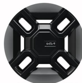
21" felgi aluminiowe (GT-Line)