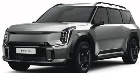
Pebble Grey (DFG) metalizowany